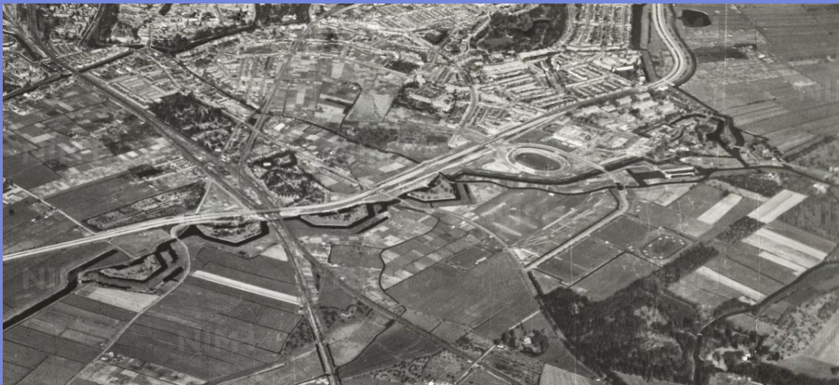
De 4 Lunetten op de Houtense Vlakte in 1940. De rijksweg A22 (Waterlinieweg) is net gereed gekomen.

Bij Het Utrechts Archief ga ik verder met de toeleidende wegen te onderzoeken waaronder de Waterlinieweg en de rijksweg A12. Al verwacht ik hier klaar mee te komen met deze categorie in de loop van dit voorjaar.